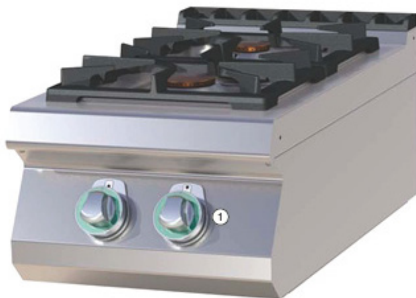
① Bouton de régulation